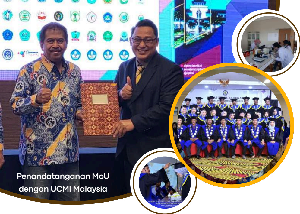
Penandatanganan MoU dengan UCMi Malaysia